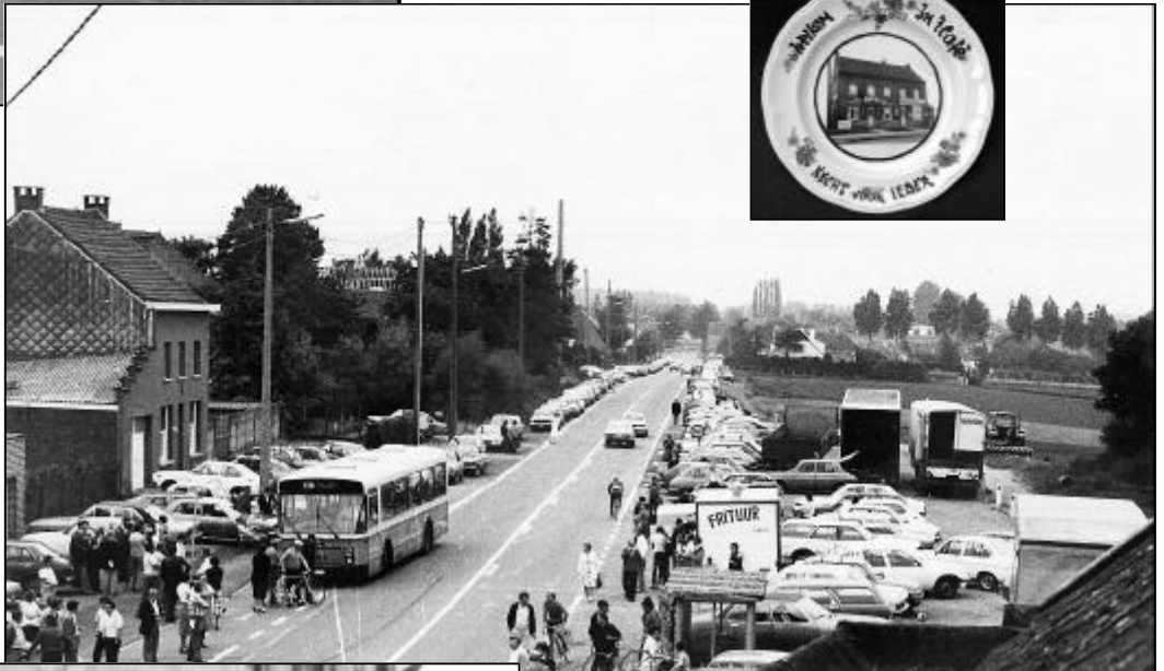
Zo zag de Statie er uit toen in de jaren zeventig een wielervedstrijd werd georganiseerd. Op de oude losplaats werd er "ongedisciplineerd" geparkeerd.