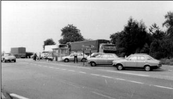
Boven een foto van het dagelijkse beeld van de "parking" aan het bushokje. Wagens die een plaatsje krijgen tussen de vrachtwagens.